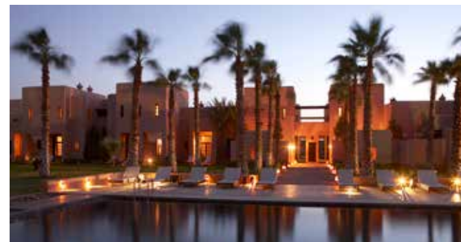
Hapimag Resort Marrakech, Maroc